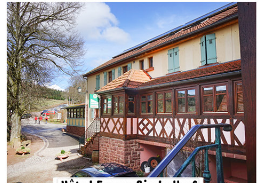
Hôtel Ferme Gimbelhof

40 rue Principale F-67510 Obersteinbach Tel. 0033 (0) 388095501 www.restaurant-anthon.fr