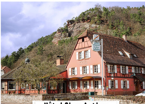
Hôtel Chez Anthon

40 rue Principale F-67510 Obersteinbach Tel. 0033 (0) 388095501 www.restaurant-anthon.fr